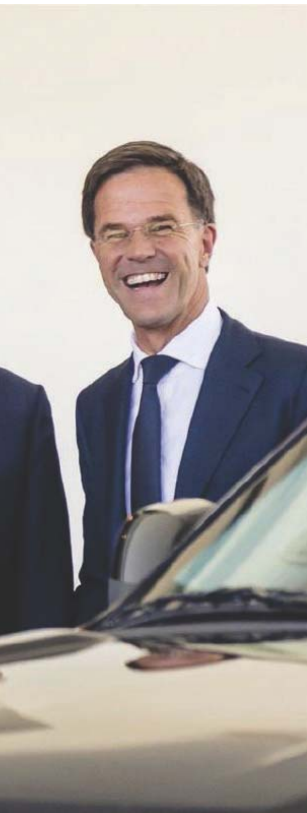
Segretario Generale della Nato

considerato illegittimo il divieto all'integrazione al minimo per l'assegno ordinario d'invalidità, spettante al lavoratore che, a causa di infermità o difetto fisico o mentale, vede diminuita a meno di un terzo la sua capacità di prestare un'attività lavorativa confacente. Il divieto era previsto dalla riforma Dini del 1995. L'assegno, quindi, se non raggiungerà sulla base dei contributi versati i 603 euro al mese del trattamento minimo, sarà integrato fino al raggiungimento di questa cifra.