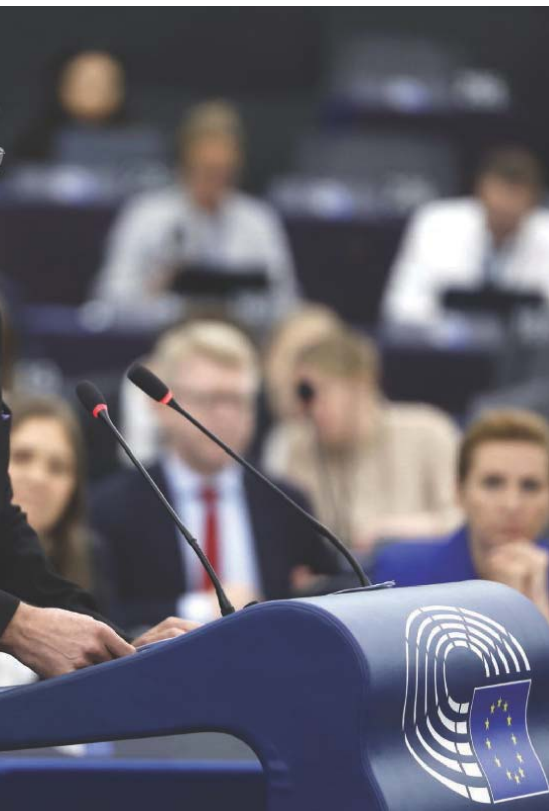
e la sicurezza economica

Ma la domanda che vorremmo porre ad Alessandro Campi a questo proposito è se la posizione debole che egli constata nel governo italiano sia solo espressione di un errore di valutazione circa il modo in cui si deve trattare con l'America di Trump o sia invece il segno di una scelta politica a favore di quest'ultimo anche a danno degli interessi dell'Europa e dell'Italia. Questo è un punto cruciale che meriterebbe un ulteriore approfondimento.