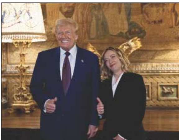
Il presidente Usa, Donald Trump, con la premier Giorgia Meloni

Giorgia Meloni, piuttosto avara di dichiarazioni, ha scelto di restare attaccata all'Ue con toni molto dimessi e d'altra parte non poteva fare altro: non ha la forza né lo standing di un Emmanuel Macron che sta alzando i toni al massimo praticamente su tutto, dei dazi alla necessità storica del riarmo. Piuttosto la premier deve guardarsi da una Lega che a momenti è contenta dei dazi trumpiani potenzialmente in grado di annichilire l'odiata Euro-