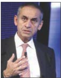
Il lord inglese rapinato nei pressi della Piazzetta di Capri

Darzi - 65 anni, docente universitario, chirurgo di fama ed esponente del Partito Laburista - stava passeggiando per le stradine di Capri assie-