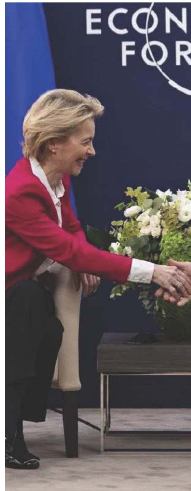
Da sinistra, la presidente della Commissione europea Ursula von der Leyen

Gli Usa verso la transizione a una condizione "estrattiva"