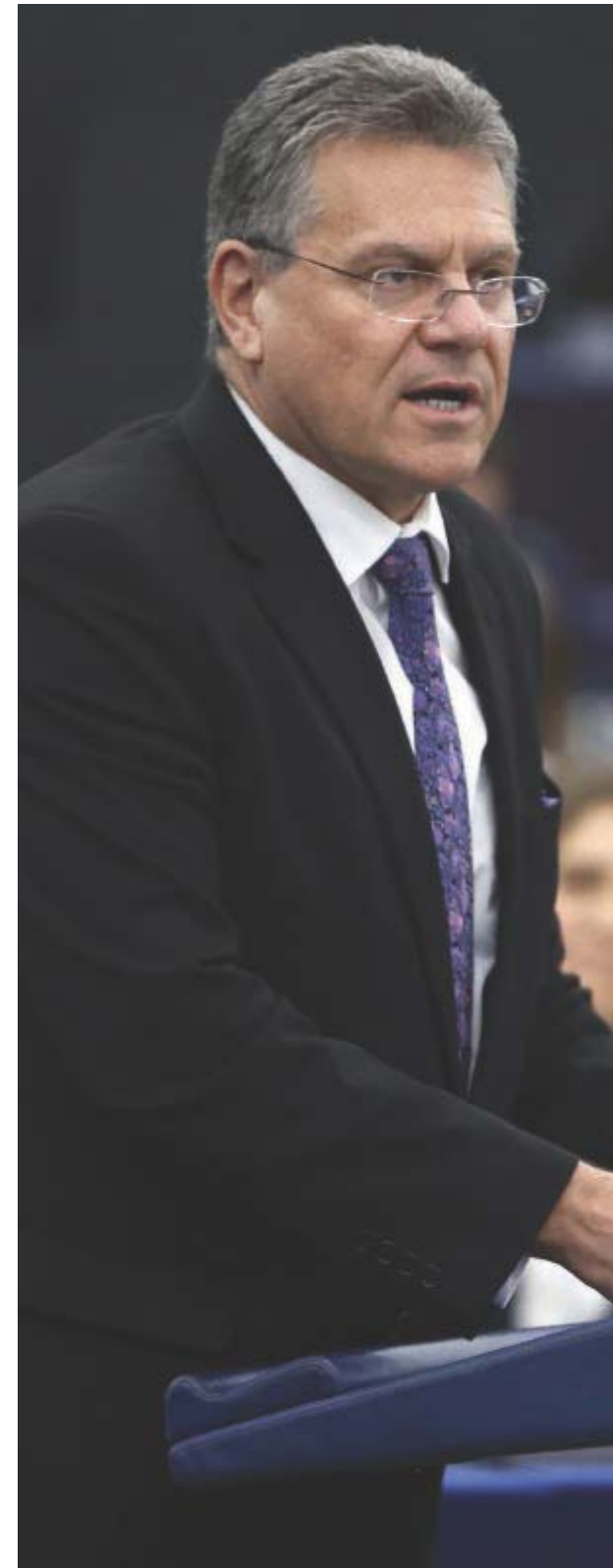
Maros Sefcovic, commissario europeo per il commercio e la sicurezza

Dall'altra parte ci sono le colombe, tra cui Italia e Germania. La premier Meloni si è offerta da mesi per fare la pontiera tra Ue e Usa. Berlino ieri