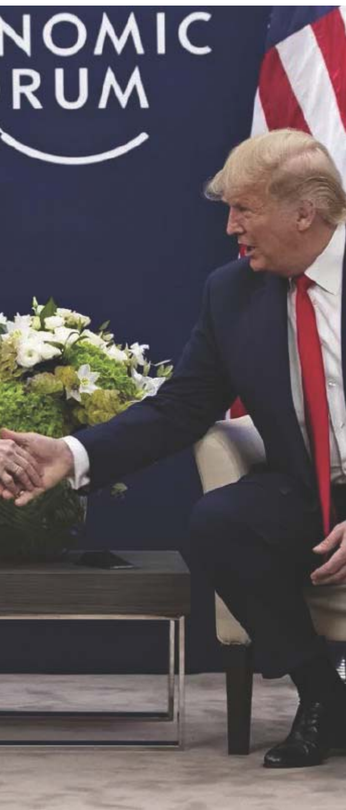
Ursula von der Leyen e il presidente americano Donald Trump.

sua undicesima edizione, per la prima volta anche la Papua Nuova Guinea ospiterà un'attività di Talisman Sabre, segno dell'approfondimento dei legami di difesa tra l'Australia e il suo vicino settentrionale. La Cina ha spesso inviato navi da sorveglianza per monitorare le manovre militari biennali al largo della costa del Queensland. Le esercitazioni militari sono iniziate in contemporanea con la visita del primo ministro Albanese in Cina, che non figura tra i Paesi partecipanti.