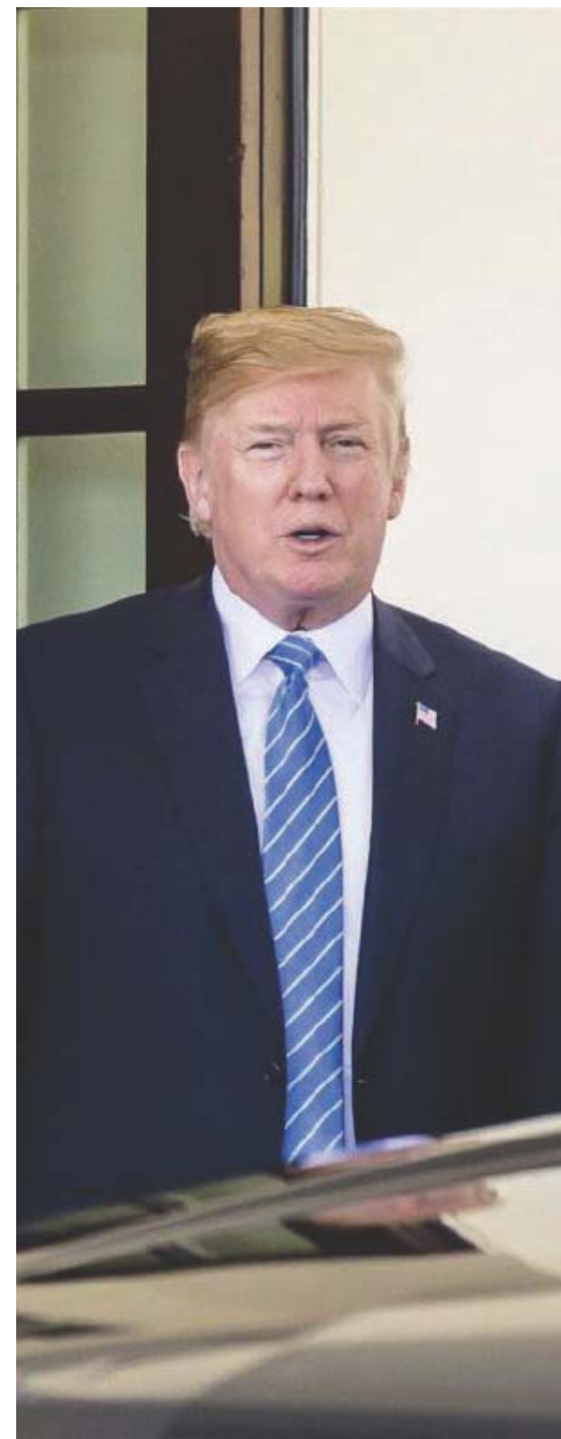
Il Presidente degli Stati Uniti Donald Trump e Mark Rutte, Segretario

Andrius Kubilius: «Abbiamo bisogno di un'area Schengen militare»