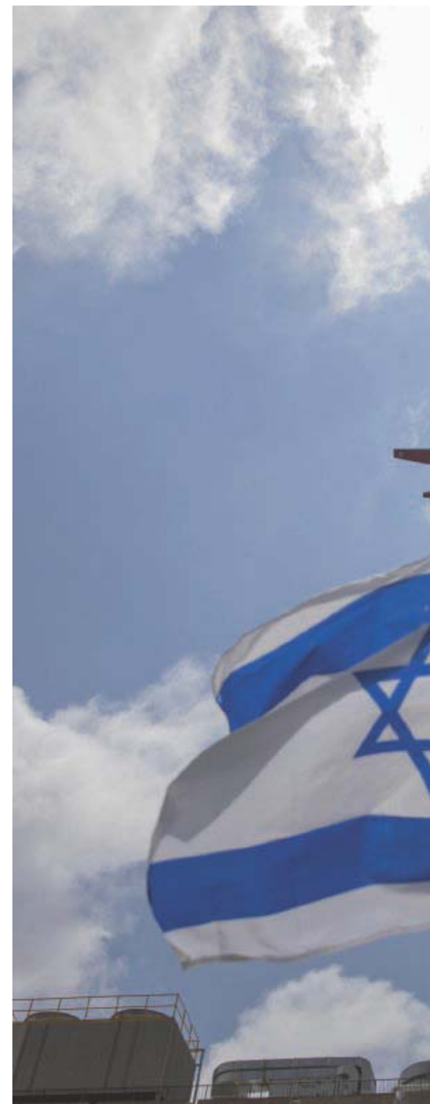
Tra le minacce al suo governo e le critiche dell'opinione pubblica,

di mantenere la maggioranza, specialmente alla luce dei sempre crescenti diverbi interni anche alle altre forze che lo sostengono e alla crescita di popolarità dell'opposizione. Per questo, difficilmente il primo ministro rischierà la sua coalizione pur di non concedere agli ultraortodossi l'esenzione militare che tanto desiderano. Il problema, semmai, sarà trovare il supporto parla-