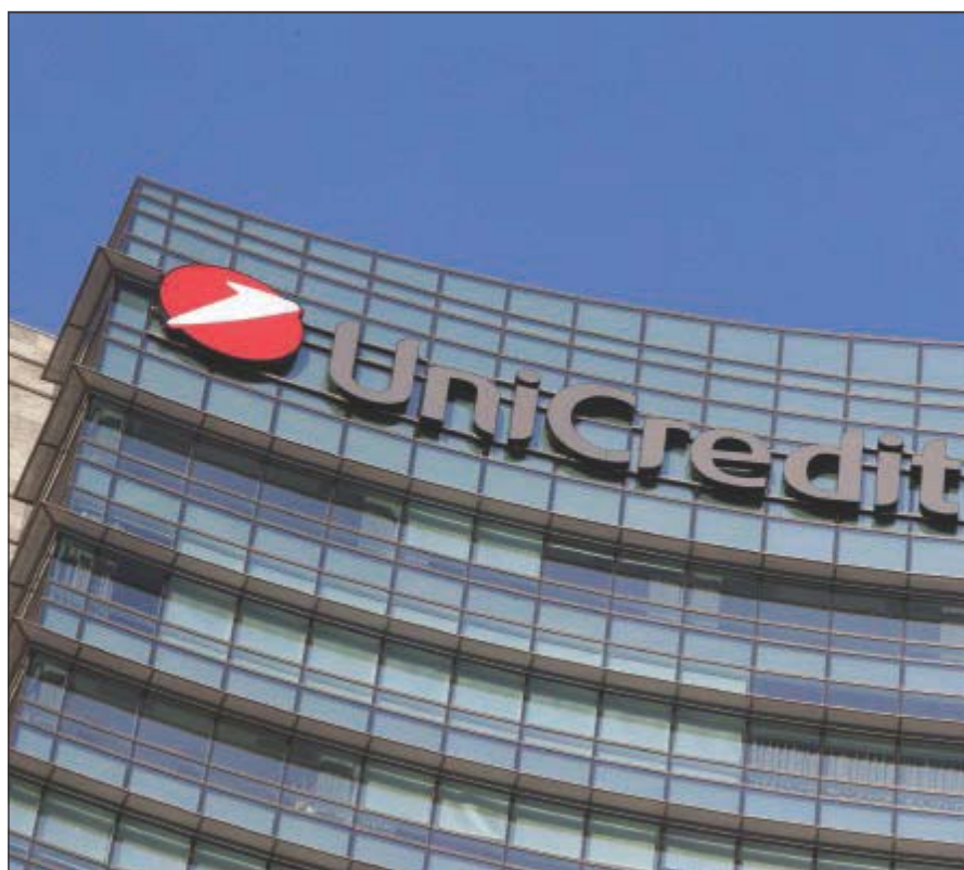
L'Opa di Unicredit su Bpm scadrà il 23 luglio 2025

La Commissione Ue ha chiesto a Palazzo Chigi chiarimenti entro 15 giorni