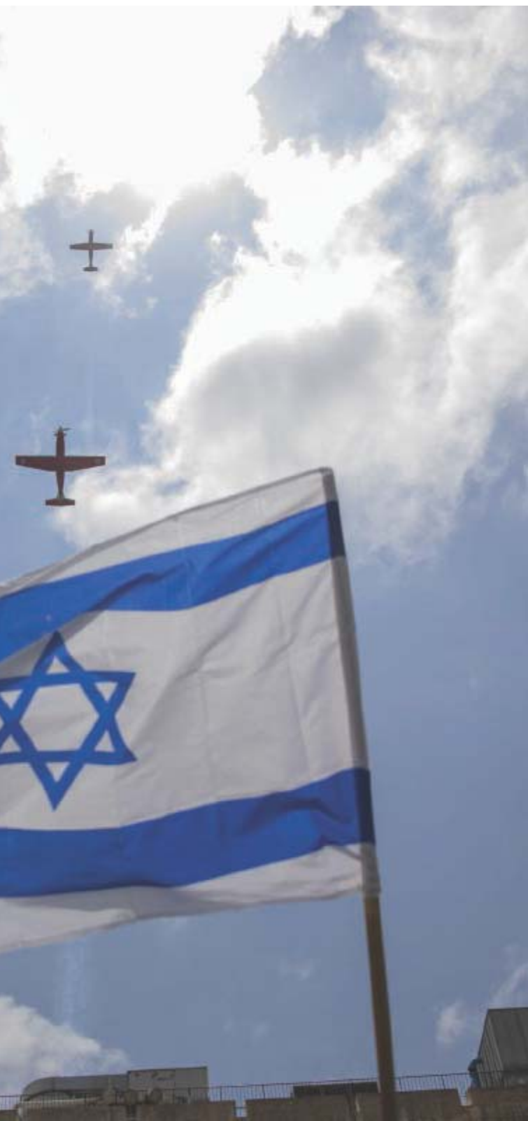
pubblica, Israele continua ad essere nell'occhio del ciclone

impianto 5.0 per la produzione di Zinco stannato idrossido, un additivo chimico green destinato ad applicazioni industriali high-tech, con un'eccellente carbon footprint. Lo Zhs, prodotto da Scl dal 2011, è un antifiama innovativo per materiali come Pvc e nylon: non tossico, favorisce il riciclo dei polimeri a fine vita e riduce la generazione di fumi in caso di incendio. Il nuovo impianto consentirà a Scl di raddoppiare la capacità produttiva e abbattere i consumi energetici per unità di prodotto.